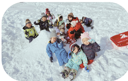
たんぽぽくらぶで雪遊び

に始まり忍者ごっこ、警察ごっこ、タイ焼き屋さん、たんぽぽくらぶでお店屋さんごっこおにぎり屋さんなど色々なものになりきって楽しく遊びを展開しています。これからもどんどん発展して楽しめそうです。また、部屋には季節に合わせたの製作物を飾り、子どもたちの作品で可愛く彩られています。時にはお遊戯室へ行き、ボール遊びや鬼ごっこなどで思いっきり身体を動かして遊ぶこともあります。子どもたちと会話のキャッチボールを楽しみながら居心地の良い空間になるよう先生方で日々工夫しながら過ごしております。